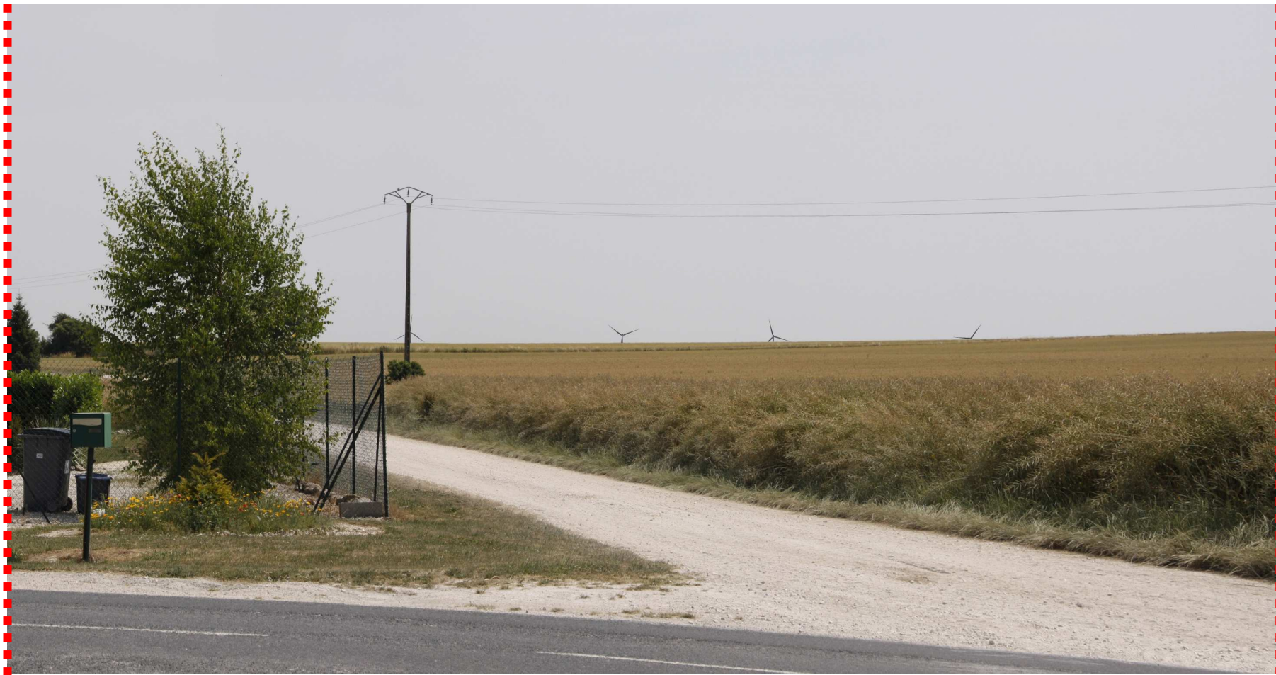
Photomontage recadré à 60°