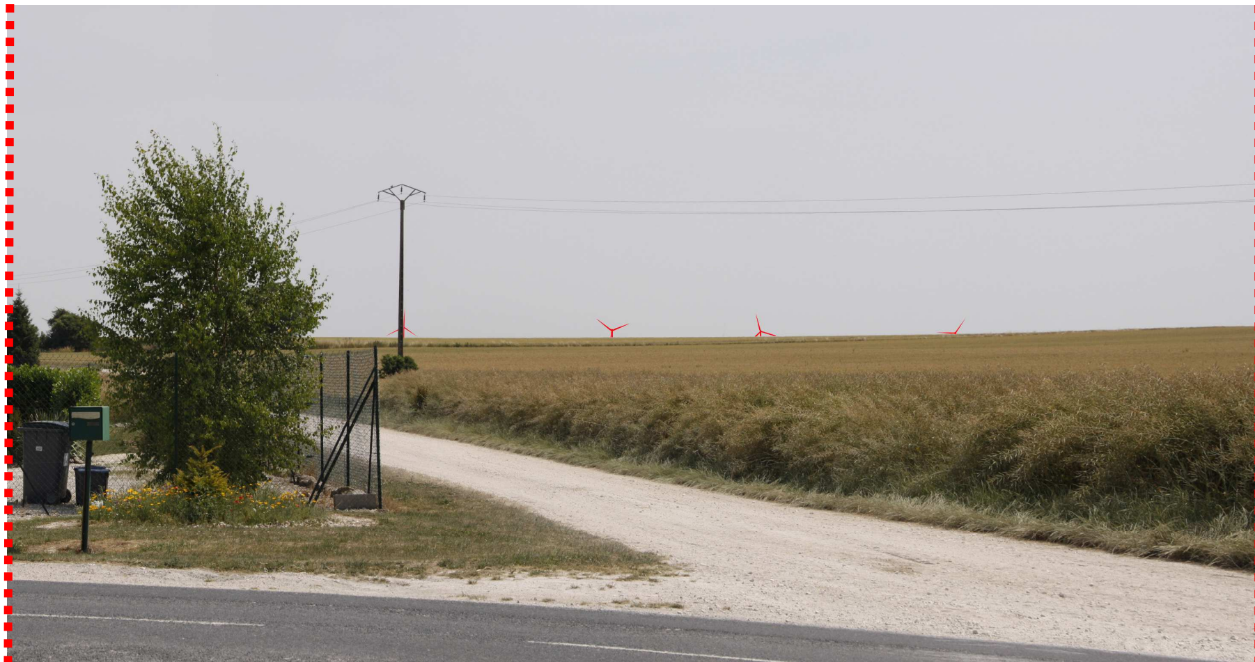
Photomontage d'interprétation recadré à 60°